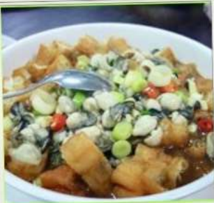
ถนนโบราณซือเฟิ่น