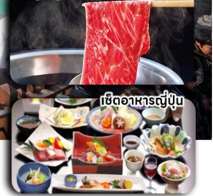
เซตอาหารญี่ปุ่น