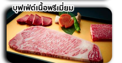
บุฟเฟ่ต์เนื้อพรีเมียม