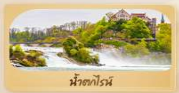
น้ำตกโรน

เที่ยวสวิตเซอร์แลนด์ สวรรค์แห่งนักผจญภัย พิชิตยอดเขา Grindelwald First และ Jungfrau ไม่พลาดเมืองดังลูเซิร์น ซูริค อินเทอร์ลาเคน ชุก กรุงเบิร์น เพลิดเพลินกับความงดงาม สะพานไม้ชาเปล สิงโตแกะสลัก นาฬิกา ไซท์ กล็อกเคิล ไลน์สโตนเฮาส์ ชมความน่ารักบ่อหมีสีน้ำตาล พลังน้ำที่ยิ่งใหญ่ ที่สุดในยุโรป! น้ำตกโรน ซ็อบปีงถนนบาห์นโฮฟชตราเซอร์