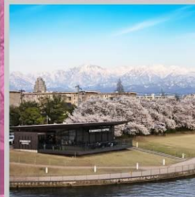
"TOYAMA KANSUI PARK"