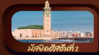
มัสยิดฮัสซันที่ 2

มือพิเศษ อาหารไทย-จีน อาหารพื้นเมืองโมร็อกโก