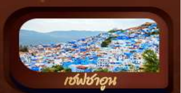
เชฟชาอูน