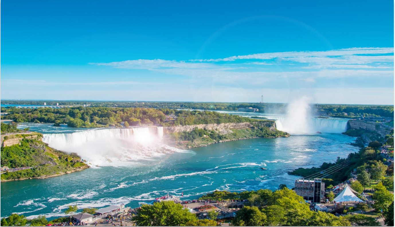
NIAGARA FALLS STATE PARK

นำท่านเดินทางสู่ “อุทยานแห่งชาติไนแอกการ่า” (Niagara Falls State Park) ฝั่งสหรัฐอเมริกา หนึ่งในสิ่งมหัศจรรย์ทางธรรมชาติของโลก ที่ได้รับการยกย่องให้เป็นสถานที่ท่องเที่ยวยอดนิยม และเป็น หนึ่งในสามจุดหมายปลายทางสุดโรแมนติกสำหรับการดื่มด่ำน้ำผั่งพระจันทร์ของคู่บ่าวสาวชาวอเมริกัน น้ำตกไนแอกการ่า