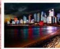
หาดโซเบอร์ NO.3