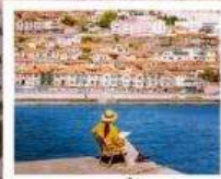
หาดซาจื่อฮั่ว