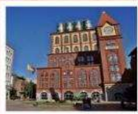
โรงงานเบียร์ชิงเต่า