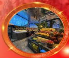
มือพิเศษ บุฟเฟต์นานาชาติ