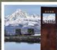
ป่ากลางเจียงตู