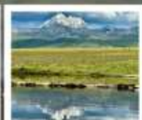
ดวงดาวแห่งต่าง