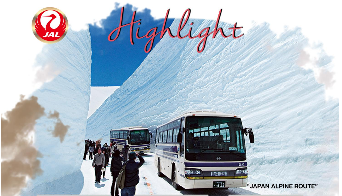
“JAPAN ALPINE ROUTE”