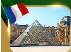
พีระมิดที่ลูฟวร์ ปารีส