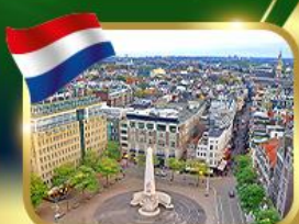
จัตุรัสดีนสแควร์ อัมสเตอร์ดัม