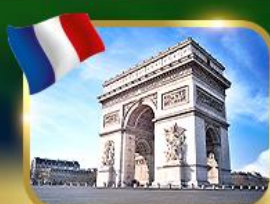
ประตูชัยฝรั่งเศส ปารีส