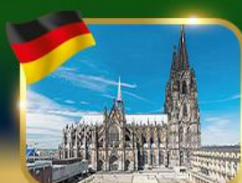
มหาวิหารแห่งเมืองโคโลญ