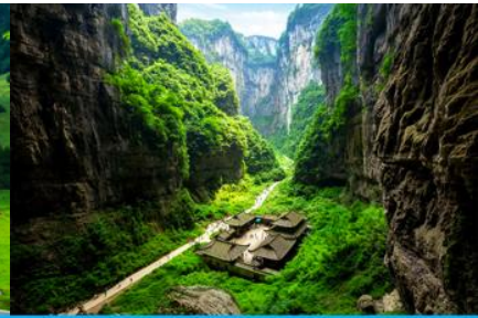
สะพานธรรมชาติสามแห่ง