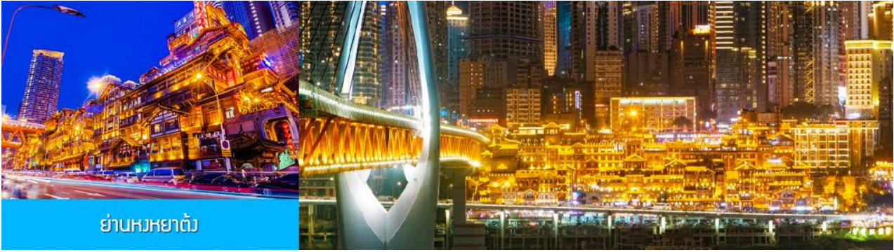
ย่านหยงหยาดัว