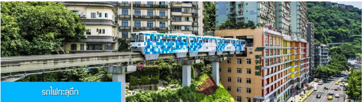
รถไฟทะลุตึก

พักที่ JINGUAN HOTEL โรงแรมระดับ 4 ดาวหรือเทียบเท่าในเมืองเฉียนเจียง