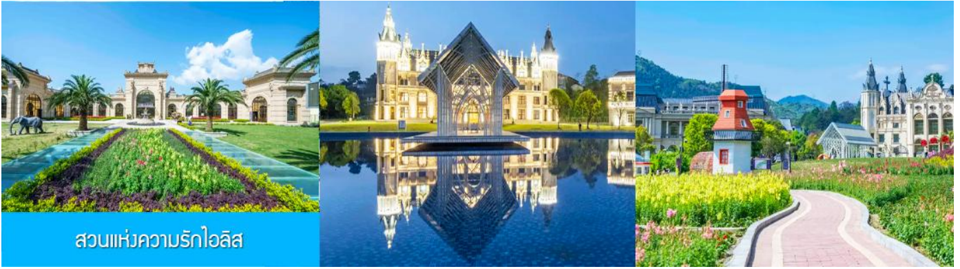
สวนแห่งความรักไอลิส