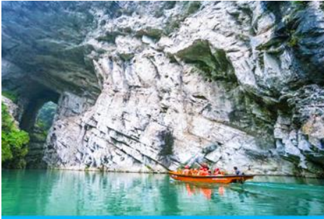
ล่องเรือล่ำธารใต้ดินผู่ฮวา