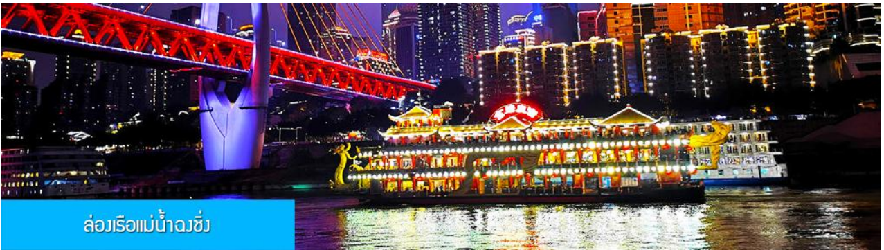
ล่องเรือแม่น้ำวงซี

อิสระอาหารมื้อเย็น เพื่อสะดวกในการเดินเที่ยว ช้อปปิ้ง และชมอาหารพื้นเมืองกามอ๋ยฮ้าย