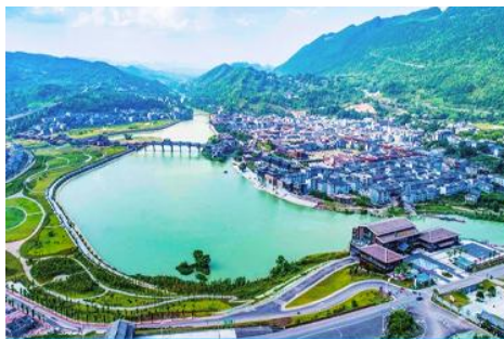
เมืองโบราณจั่วซู่ย

เที่ยง รับประทานอาหารกลางวัน ณ ภัตตาคาร (5)