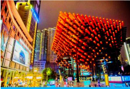
หอศิลป์กั๋วไท่