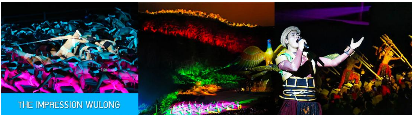
THE IMPRESSION WULONG