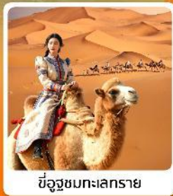
ขี่อูฐชมทะเลทราย