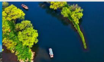
อ่าวพระจันทร์