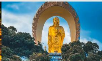
พระใหญ่ตงหลิน