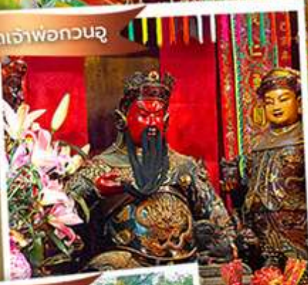
วัดหลินฟาง