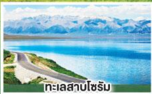
ทะเลสาบไซรัม