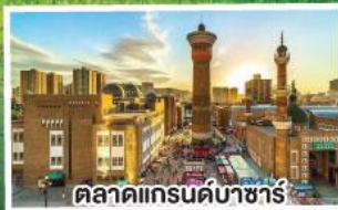
ตลาดแกรนด์บาซาร์