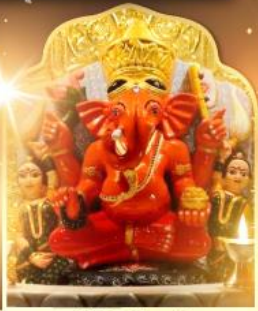
องค์สิทธีวินายก