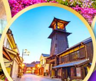
หอรบั้งโทคิโนะคาเนะ