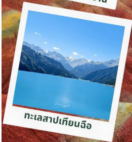
ทะเลสาปเทียนฉือ