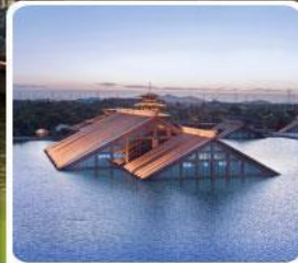
พิพิธภัณฑ์ไดน้ำ กวางฟู่หลิน