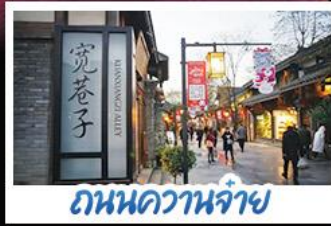
ถนนชุนซีลู่