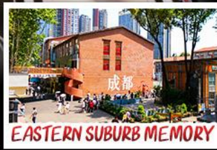
EASTERN SUBURB MEMORY