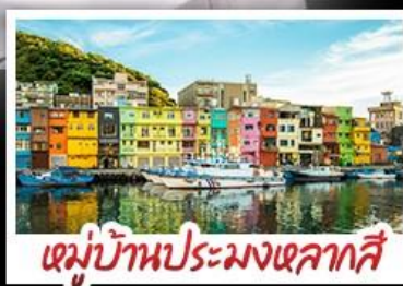
หมู่บ้านประมงเหลากสี