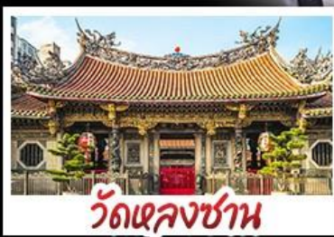
วัดเจหลงซาน