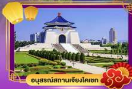
อนุสรณ์สถานเจียง ไคเชก