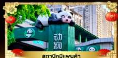
สถานีหมีแพนด้า