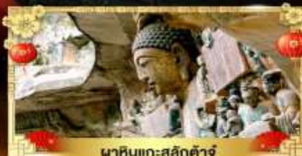
นาหินแกะสลักต้าจู้