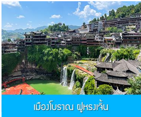
เมืองโบราณ ฝูหรงเจิ้น

จากนั้นนำท่านเดินทางสู่เมืองฝูหรงเจิ้น นำท่านเที่ยวชม เมืองโบราณ ฝูหรงเจิ้น 芙蓉古镇 เมืองโบราณเก่าแก่ขึ้นชื่อของมณฑลหูหนานที่โด่งดังจาก ภาพยนตร์เรื่อง ฝูหรงเจิ้น เป็นสถานที่ท่องเที่ยวระดับ 4A ที่ได้รับความนิยมจากนักท่องเที่ยวคู่กับเมืองโบราณฟงหวง เป็นสถานที่หลักในการถ่ายทำภาพยนตร์เรื่อง ฝูหรงเจิ้น ทำให้สถานที่แห่งนี้ยังได้รับความนิยมจากนักท่องเที่ยว จุดไฮไลท์ของเมืองโบราณแห่งนี้ นอกจากบ้านเรือนโบราณสวยเก๋ที่เป็นเอกลักษณ์เฉพาะของมณฑลหูหนาน ที่ยังมีน้ำตกขนาดใหญ่ที่สวยงามกลางเมืองที่เป็นจุดเช็คอิน