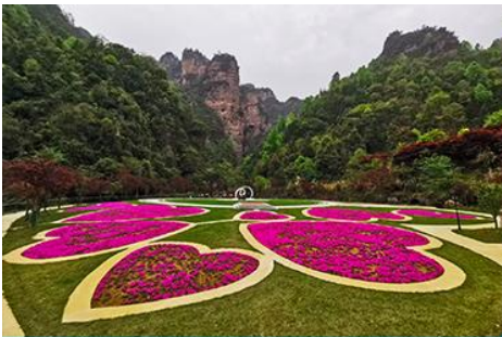
อุทยานฟงเลียนซี