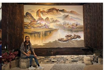
พิพิธภัณฑ์ภาพถ่ายเขียนหินทราย

วันที่สี่ เมืองจางเจียเจี๋ย- ศูนย์ผลิตภัณฑ์หยก –ร้านใบชา – พิพิธภัณฑ์ภาพถ่ายเขียนหินทราย-ไกด์นำเสนอโปรแกรมเสริม สะพานกระจกแกรนด์แคนยอน- เมืองหยี่เซียง