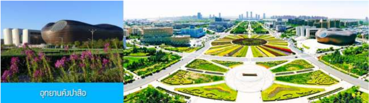
อุทยานคังปาสื่อ