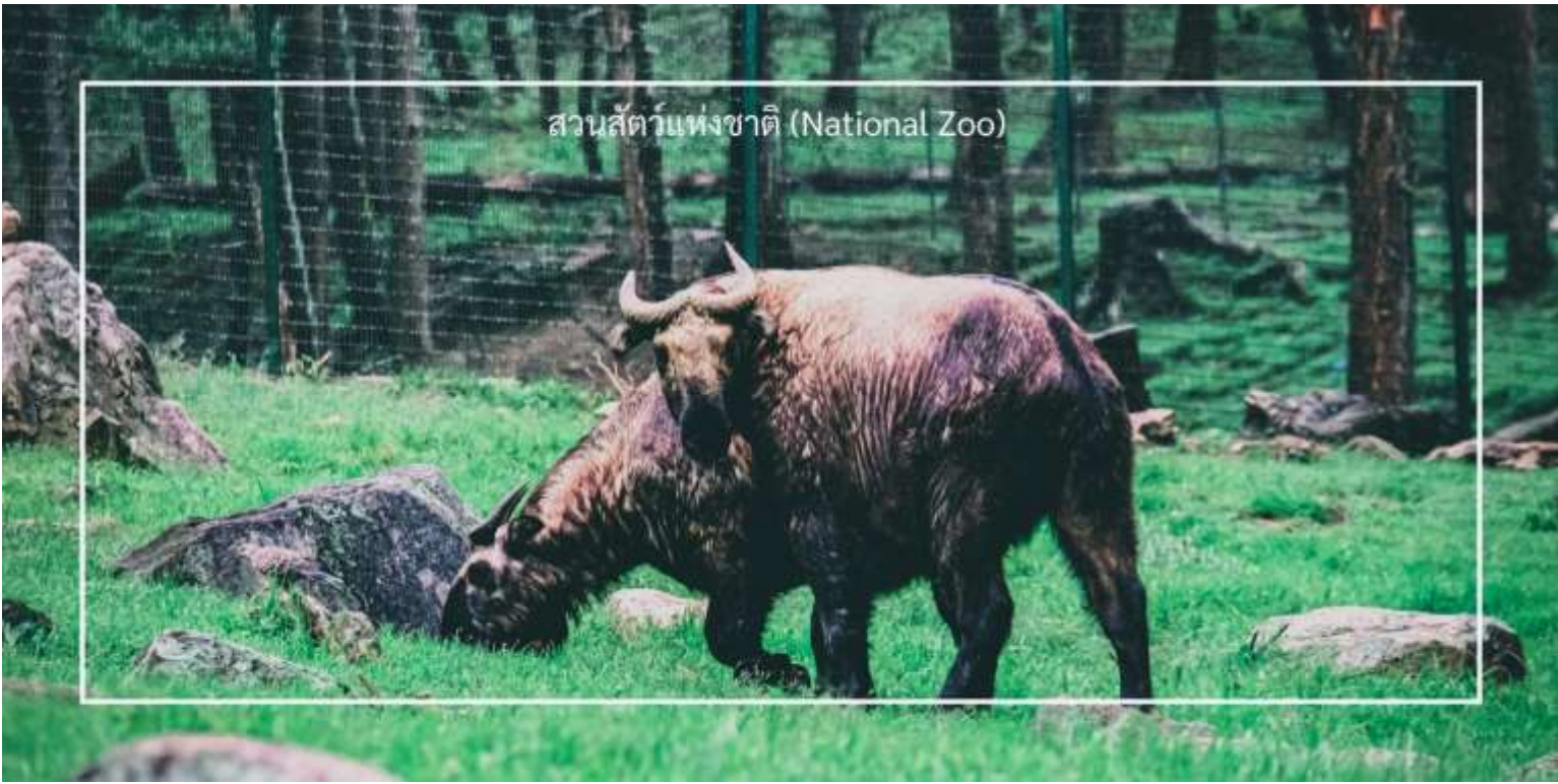
สวนสัตว์แห่งชาติ (National Zoo)

เที่ยวชม จุดชมวิวซังเกกัง (Sangaygang Viewpoint) เป็นหนึ่งในจุดชมวิวที่สวยงามในเมืองทิมพู (Thimphu) ตั้งอยู่บนเนินเขาที่สูง ทำให้ผู้เข้าชมสามารถมองเห็นทิวทัศน์ที่งดงามของเมืองทิมพูและภูเขารอบๆ จุดชมวิวนี้อีกมีทิวทัศน์ที่สวยงามของเมืองทิมพูและเทือกเขาหิมาลัย โดยเฉพาะในวันที่อากาศแจ่มใส นักท่องเที่ยวสามารถเห็นวิวที่กว้างไกลได้อย่างชัดเจน