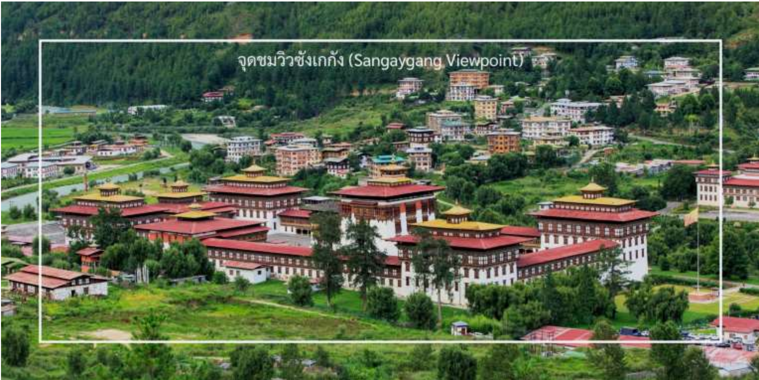
จุดชมวิวซังเกกัง (Sangaygang Viewpoint)

ออกเดินทางสู่เมืองพาโร โดยใช้เวลาเดินทางประมาณ 50 นาที