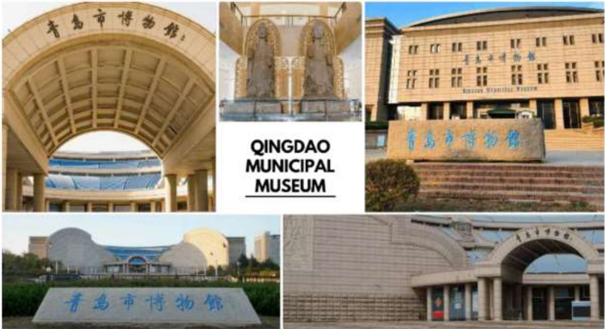
QINGDAO MUNICIPAL MUSEUM