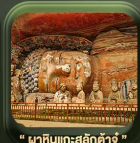
“ พาหินแกะสลักต้าจู้ ”

T2G-CKG26CZ Special of Chongqing... ซึ่ง อุ้หลง ต้าจู้ อุ้หลง อุทยานหลุมฟ้า เขานางฟ้า 5D 3N (CZ)