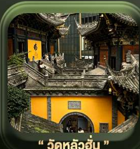
“ วัดหลิวอัน ”