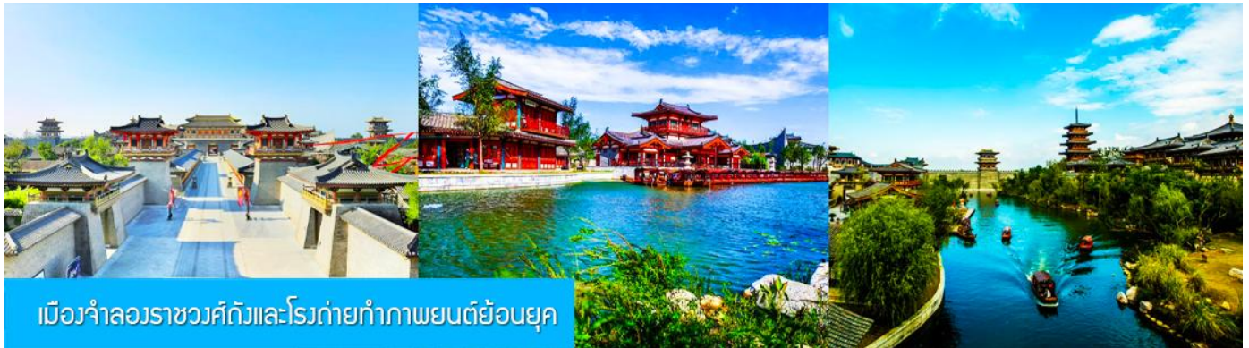
เมืองจำลองราชวงศ์ถังและโรงถ่ายทำภาพยนตร์ย้อนยุค