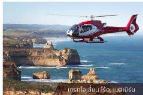
เฮลิคอปเตอร์ไฮไลน์, เมลเบิร์น