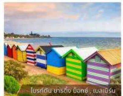
โบสถ์ดิน ชาติถึง ด็อกซ์, เมลเบิร์น