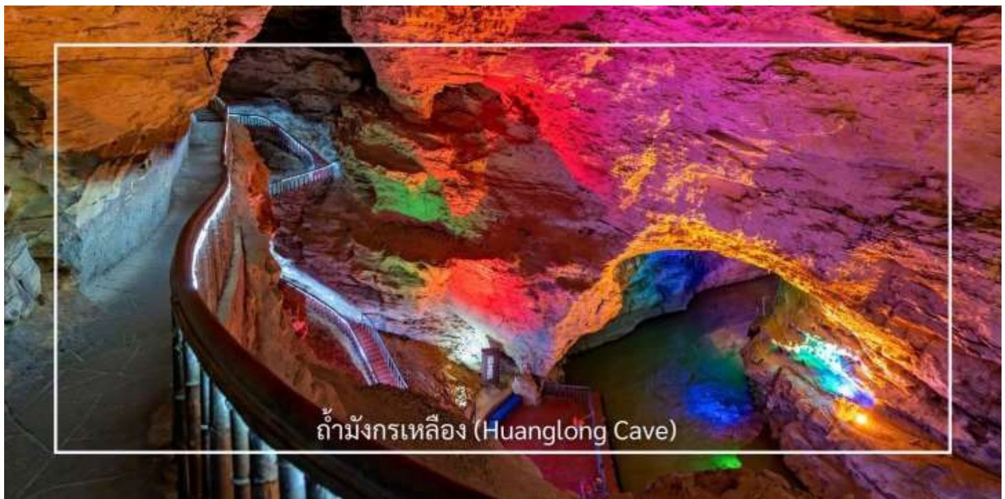
ถ้ำมังกรเหลือง (Huanglong Cave)

ท่านสามารถเลือกซื้อบริการเสริม (Option) เพิ่มเติมได้: ถ้ำมังกรเหลือง (รวมล่องเรือชมแสงสีในถ้ำ ราคา 350หยวน/ท่าน) ถ้ำมังกรเหลือง หนึ่งในถ้ำหินงอกหินย้อยที่ยิ่งใหญ่และงดงามที่สุดของเมืองจางเจี๋ยเจี๋ย แหล่งท่องเที่ยวทางธรรมชาติที่ได้รับการยกย่องว่าเป็น “พระราชวังใต้พิภพ” แห่งดินแดนอุ่หลิงหยวน ถ้ำแห่งนี้มีโครงสร้างขนาดใหญ่ แบ่งออกเป็น 4 ชั้น ภายในประกอบด้วยห้องโถงกว้างใหญ่ ลำธารใต้ดิน บึงธรรมชาติ และแนวระเบียงหินที่ทอดยาวอย่างน่าตื่นตา ความมหัศจรรย์ของหินงอกหินย้อยซึ่งก่อตัวสะสมมาเป็นเวลาหลายล้านปี ได้รับการจัดแสงอย่างสวยงาม ช่วยขับเน้นรูปร่างแปลกตาให้โดดเด่นราวงานศิลป์จากธรรมชาติ สัมผัสประสบการณ์ ล่องเรือชมแสงสีภายในถ้ำ โดยเรือจะนำท่านลัดเลาะไปตามสายน้ำใต้ถ้ำให้ท่านได้สัมผัสกับความยิ่งใหญ่ของธรรมชาติอันน่าอัศจรรย์ได้อย่างใกล้ชิด