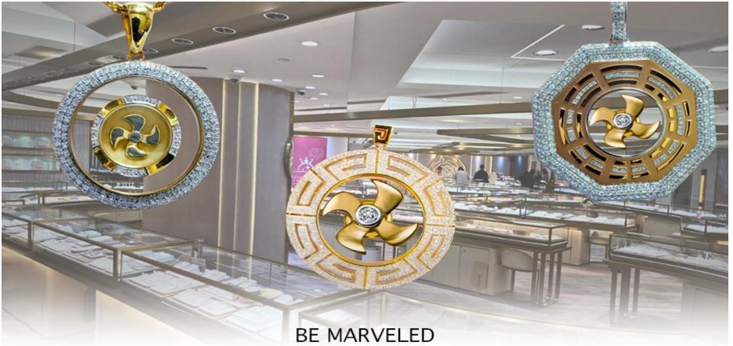
BE MARVELED ศูนย์ฮวงจุ้ย กังหันเศรษฐี

นำท่านชม ศูนย์ฮวงจุ้ย กังหันเศรษฐี ที่ขึ้นชื่อของฮ่องกง ท่านจะได้พบกับงานดีไซน์ที่ได้รับรางวัลยอดเยี่ยม และใช้ในการเสริมดวงเรื่องฮวงจุ้ย โดยการย่อใบพัดของกังหันที่เป็นสัญลักษณ์ของวัดวัดเซ่งหิม มาทำเป็นเครื่องประดับ ไม่ว่าจะเป็นจี้, แหวน, กำไล หรือต่างหูเพื่อเป็นเครื่องประดับติดตัว และเสริมดวงชะตา ซึ่งสินค้าทุกชิ้น มีเอกสาร รับประกันคุณภาพเปลี่ยนหรือซ่อม ได้ตลอดอายุการใช้งาน หากเกิดการชำรุดจากสินค้าไม่ใช่อุบัติเหตุ