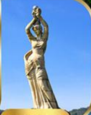
จูไห่ฟิชเชอร์ทรี