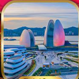
Zhuhai Opera House