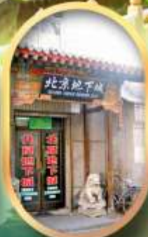
เมืองโบราณใต้ดิน