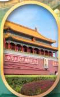
จัสมุติสเทียนอันเหมิน