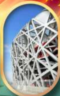
ผ่านชมสนามกีฬาโอลิมปิก