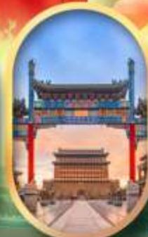
ถนนคนเดินเทียนเหมิน