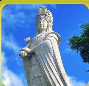
“เจ้าแม่กิมทิมหม่าโจ้ว”

เที่ยวเซี่ยะเหมิน เมืองท่าชายฝั่งทะเล • บ้านดินตุ๋นไหลว • ชมการแสดงชาวฮักกา เมืองโบราณฉวนโจ้ว • วัดโคหยวน • เจ้าแม่กิมทิมหม่าโจ้ว • โชว์ตำนานแห่งฉู่เจี้ยนใต้ เกาะกู่ลิ่งอวี่ • ถนนคนเดินหลงโถวหลู่ • วัดหนานฉู่โกว • ย่านศิลปะซาโปหย่วย