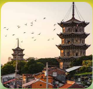
“เมืองโบราณฉวนโจ้ว”