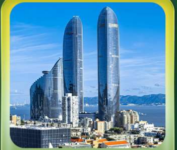
“ตึกแฝดเซี่ยะเหมิน”