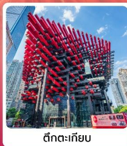
ตึกตะเกียบ