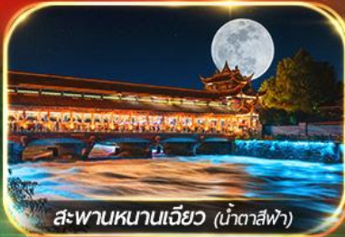
สะพานหนานเจียว (น้ำตาสีฟ้า)