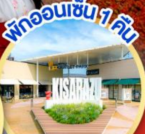
พักผ่อนเซ็น 1 คืน มิตซึย เอ้าท์เล็ต พาร์ค คิชะระชู