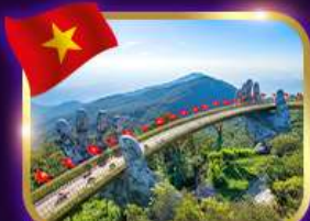
สะพานมือสีทอง บานาฮิลล์