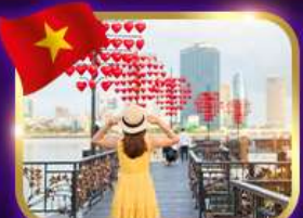
เช็คอินสะพานแห่งความรัก