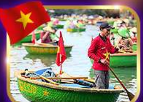
เรือกระด้ง หมู่บ้านก๊อตัน