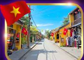
เมืองเก่ามรดกโลก ฮอยอัน