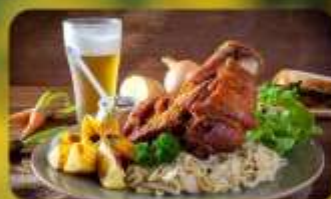
พิเศษ! ลิ้มลองเมนูประจำชาติ ทั้ง 5 ประเทศ!!!