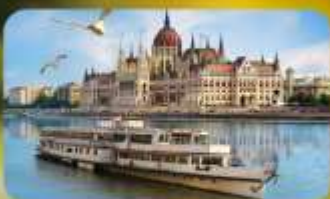
ล่องเรือแม่น้ำดานูบ พร้อมจิบแชมเปญ