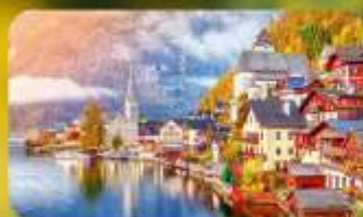
การันตีที่พัก Hallstatt / St. Wolfgang หรือริททะเลสาบ 1 คืน