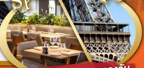
รับประทานอาหารกลางวัน บนหอคอไอเฟล