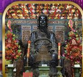
วัดปึกไต้