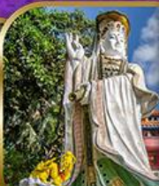
เจ้าแม่กวนอิม สวีลิสเบย์