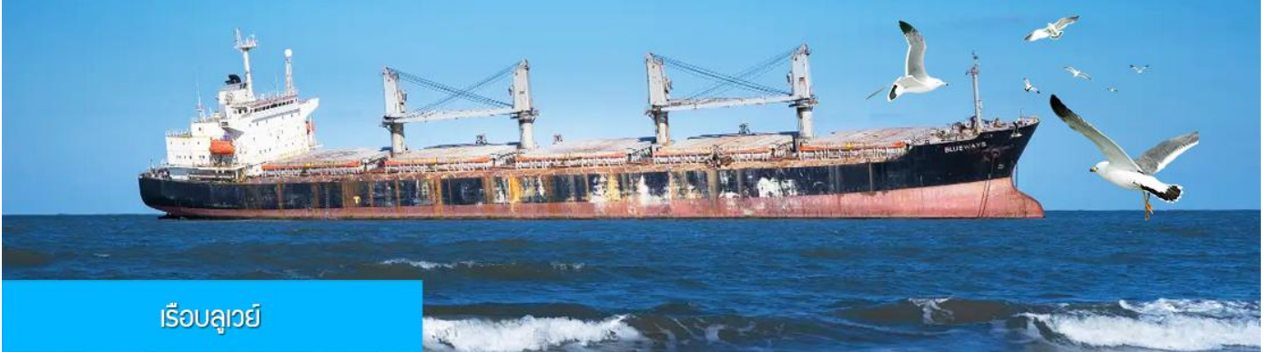
เรือบลูเวย์