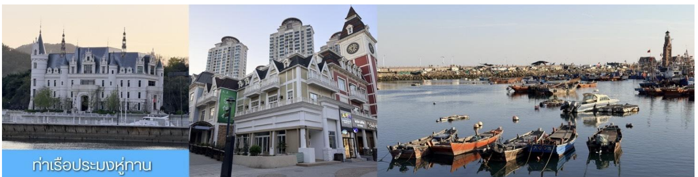
ท่าเรือประมงหู่ทาน

หลังอาหารเช้า นำท่าน เที่ยวชม ท่าเรือประมงหู่ทาน 大连渔人码头 เป็นจุดเช็คอินที่โดดเด่นด้วยสถาปัตยกรรมสไตล์ยุโรปสีสันสดใส ผสมผสานกลิ่นอายเมืองท่าดั้งเดิมเข้ากับบรรยากาศสุดโรแมนติกที่เต็มไปด้วยเรือประมง คาเฟ่ ร้านอาหาร และจุดชมวิวยามทะเล