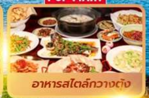
อาหารสตรีทกวางตุ้ง