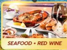
SEAFOOD + RED WINE