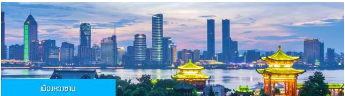
เมืองหวงชาน

ทางบริษัทฯ ขอสงวนสิทธิ์ในการสลับโปรแกรมทัวร์ตามความเหมาะสมขึ้นอยู่กับสถานการณ์หน้างาน โดยยึดถือผลประโยชน์ของลูกค้าเป็นสำคัญ