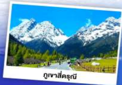
กุเวาสีครุณี