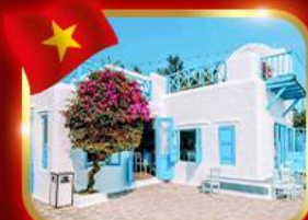
คาเฟ่สุดฮิค ซานทรา มารีน่า