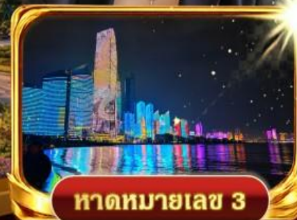
หาดหมายเลข 3