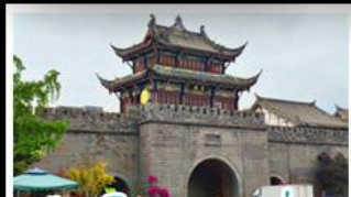
เมืองโบราณทวนเซี่ยน

ภูเขาสี่ดรุณี - อุทยานปู้ผิงโกว - สะพานหามานเฉียว - ร้านหนังสือจงซูเก๋อ - เมืองโบราณกวนเสียน จตุรัสหยางเทียนหวู่ - หมีแพนด้าเซอเฟี - ถนนโบราณชอยกวางชอยแคบ - ถนนคนเดินไท่กู๋หลี่ ถนนคนเดินซุนซี - ถนนโบราณจินหลี่ - แพนด้ายักษ์ปิ่นตึก - น้ำพุไม้ไผ่ตึกSKP - วัดต้าอ้อ