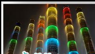
น้ำพุไม้ไผ่ตึกSKP